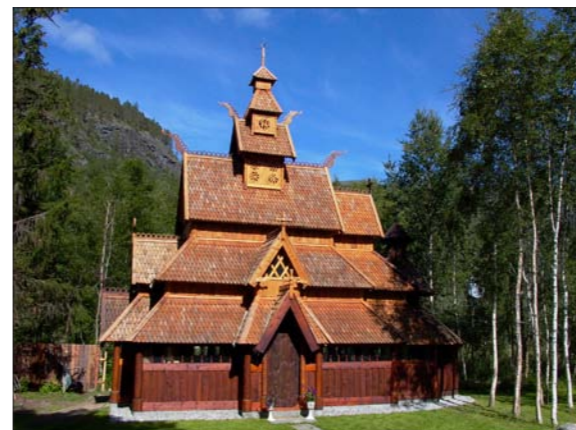
Stavkirka på Savjord

For den geologisk interesserte vil vi foreslå et besøk til Grottådalen hvor det finnes en sjelden tett konsentrasjon av kalksteingrotter fra før siste istid. Grottådalen er også kjent for sine spennende mineralforekomster og sin sjeldne og vakre flora.