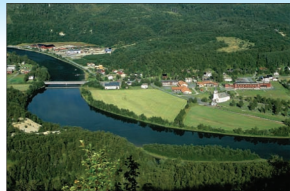
Moldjord sentrum.

Fiske i hav og fjord er gratis. For å drive fritidsfiske i ferskvann, må du kjøpe fiskekort og ha tillatelse hos grunneier.