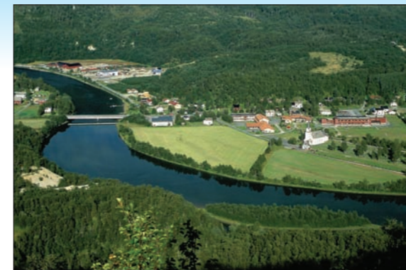
Moldjord sentrum.

Fiske i hav og fjord er gratis. For å drive fritidsfiske i ferskvann, må du kjøpe fiskekort og ha tillatelse hos grunneier.